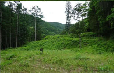
信濃日光・若澤寺跡